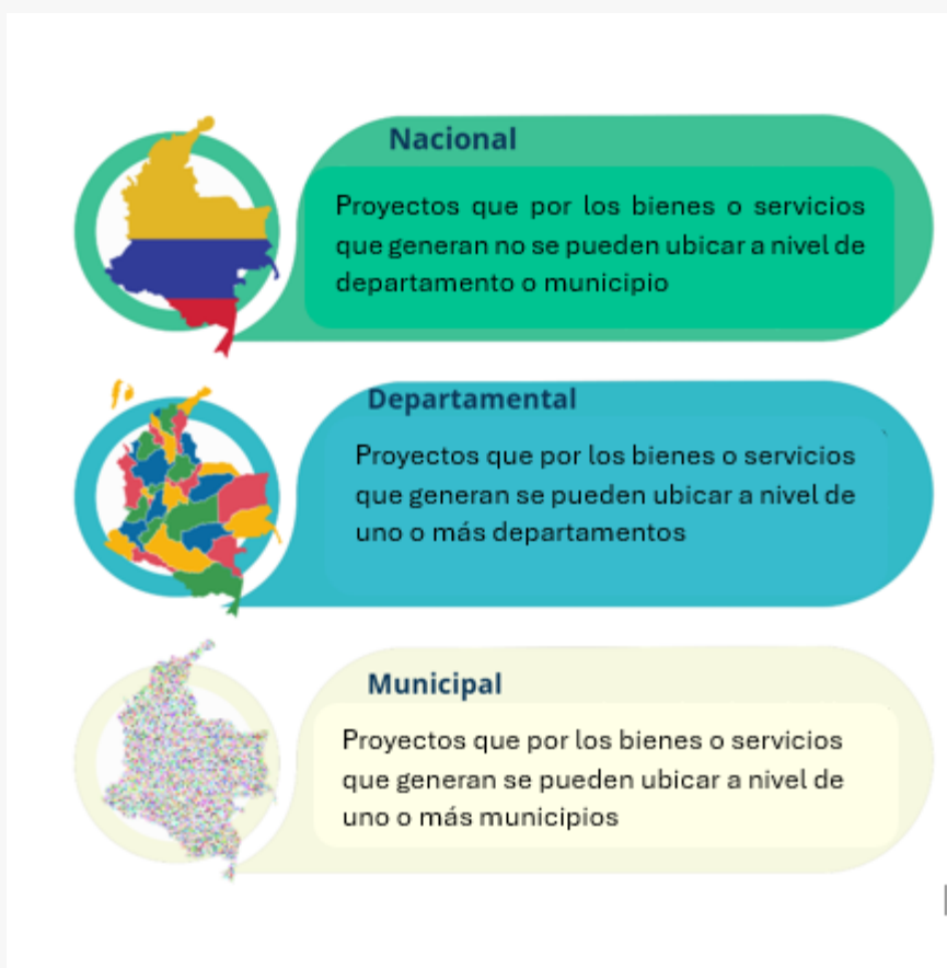
Gráfico 1. Nivel de la localización en los proyectos de inversión

En todo caso, cuando el proyecto contemple productos de diferentes características que definen su localización, se deberá tener en cuenta el ámbito geográfico más amplio. No obstante, para soportar la viabilidad del proyecto, cada producto debe contar con el análisis y los soportes pertinentes de acuerdo con su categoría.