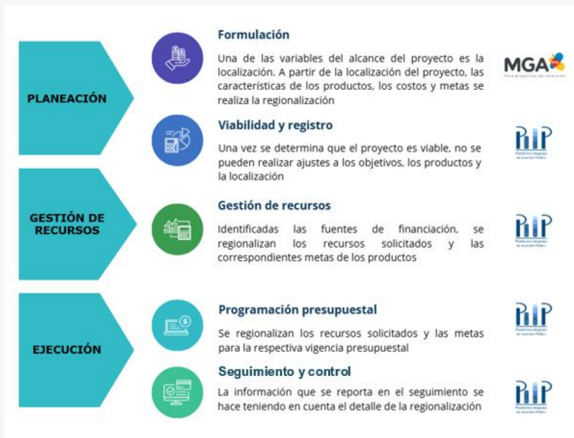
Gráfico 2. La localización y la regionalización en los procesos de gestión de la inversión pública

Desde esta perspectiva, el Gráfico 2 detalla la regionalización en los procesos en la gestión de proyectos de inversión pública: